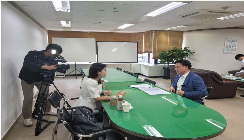
어린이 통학버스 관련 JTBC 인터뷰