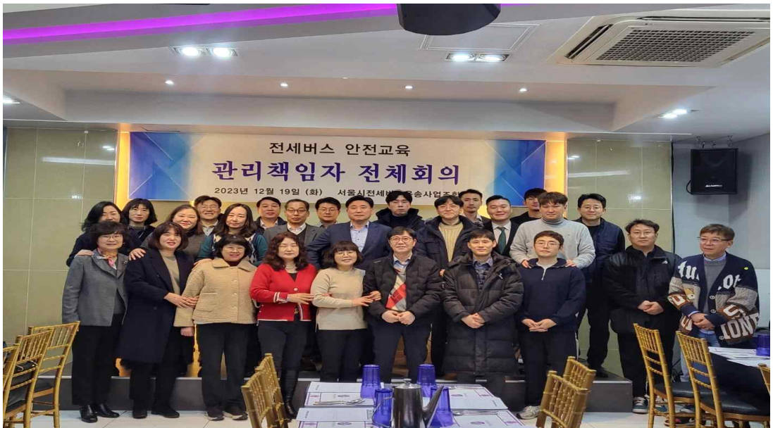
관리책임자 전체회의 (전세버스 안전교육)