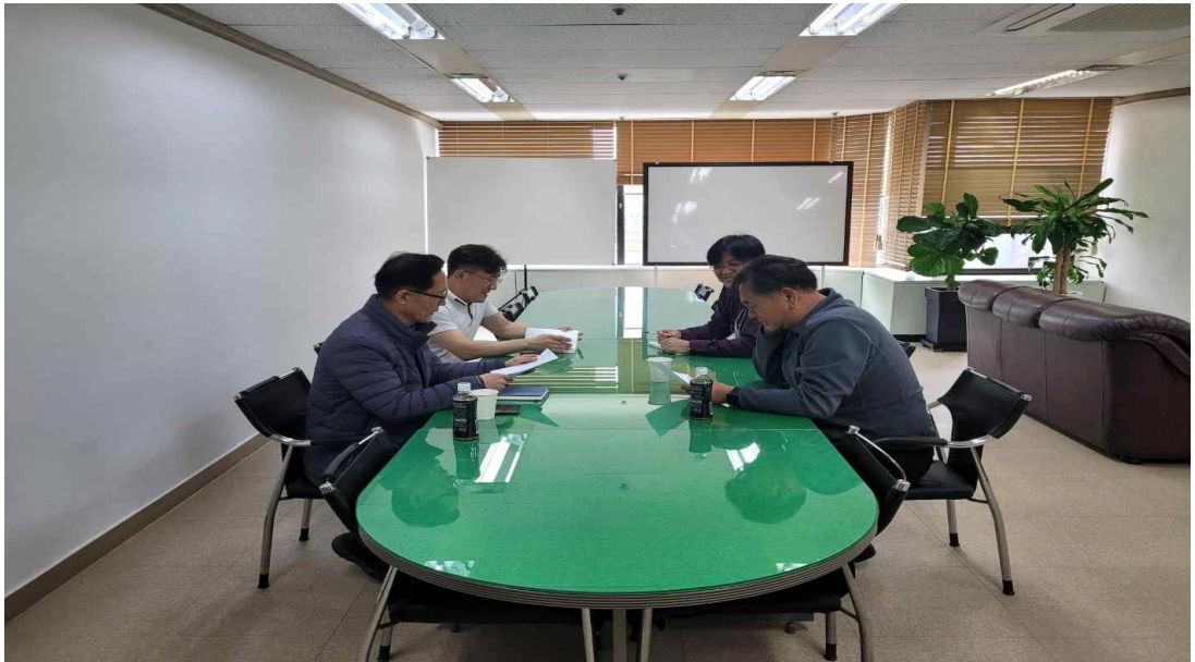
서울시 교통지도과 조합방문 간담회