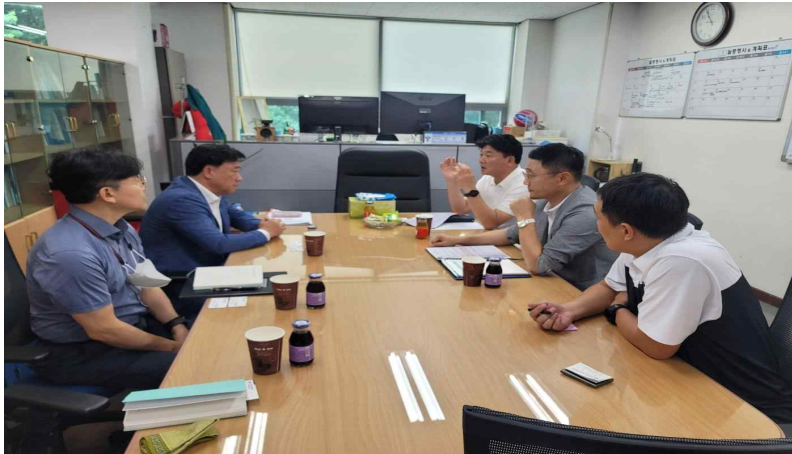
서울시교육청 체육건강문화 예술과장 면담