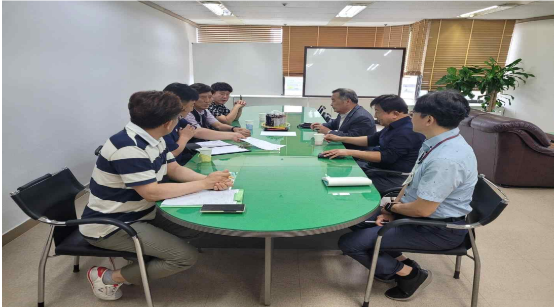
임단협 노·사 회의