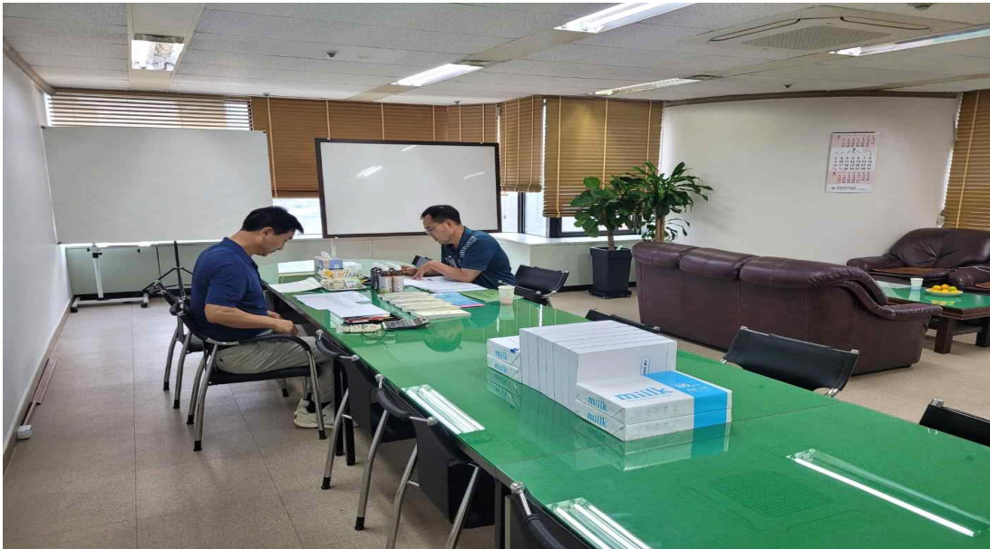
23년도 상반기 감사(7.13~14)