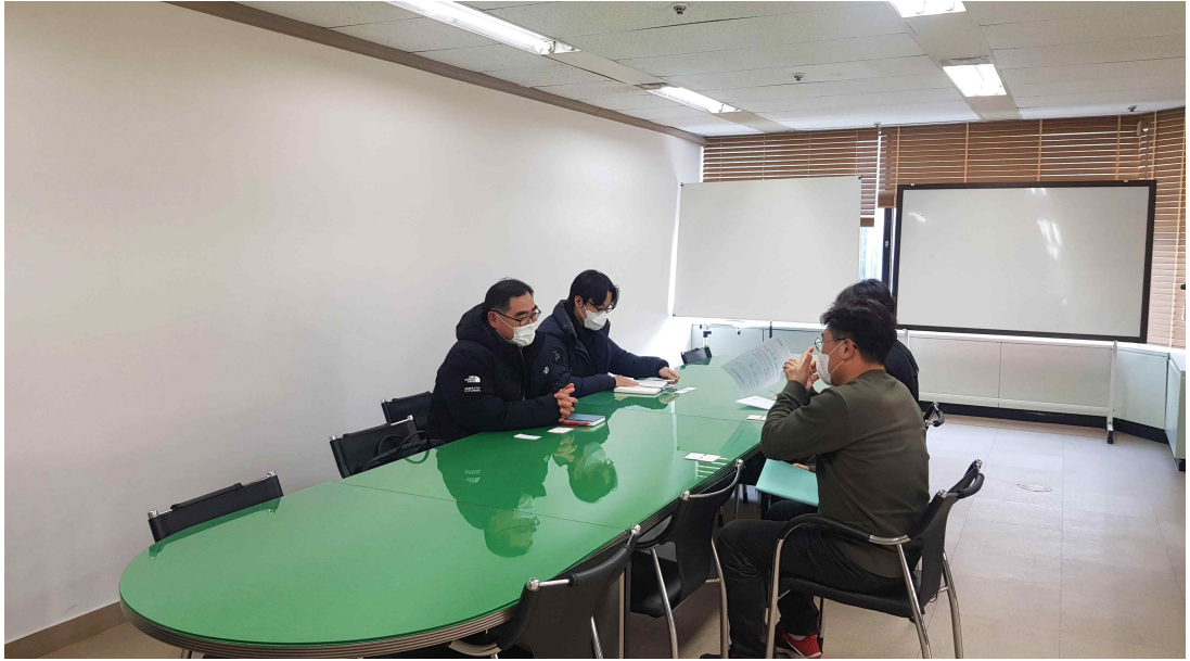
서울시 친환경정책과 그린카보급팀 조합방문 간담회