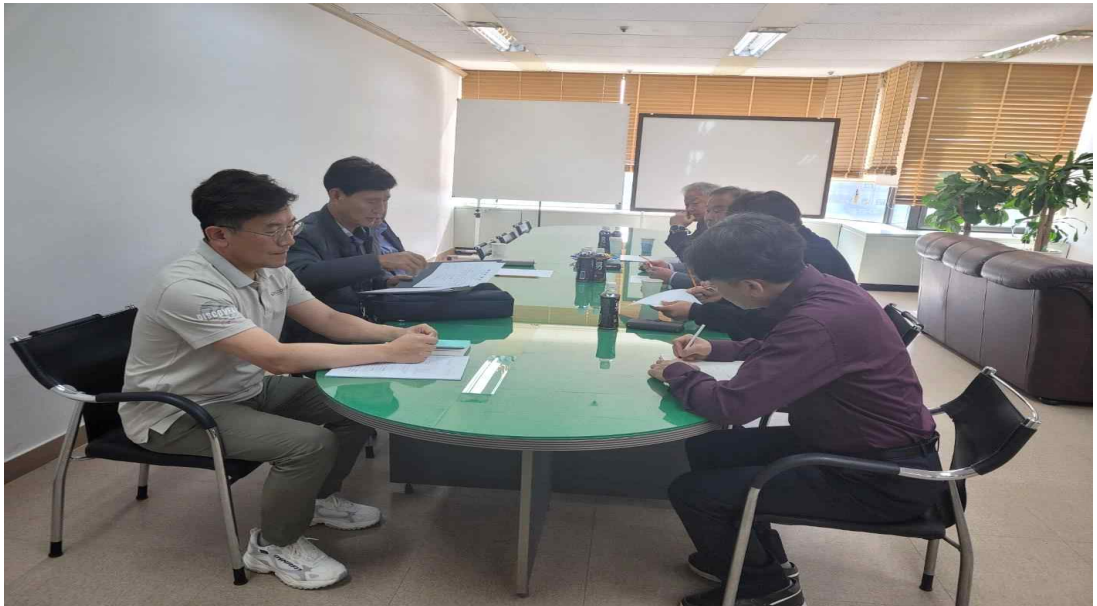
임단협 노·사 회의