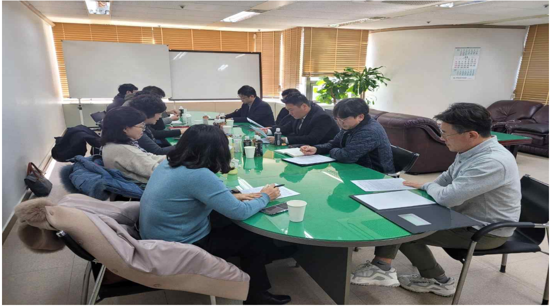
영업책임자 실무협의회 회의