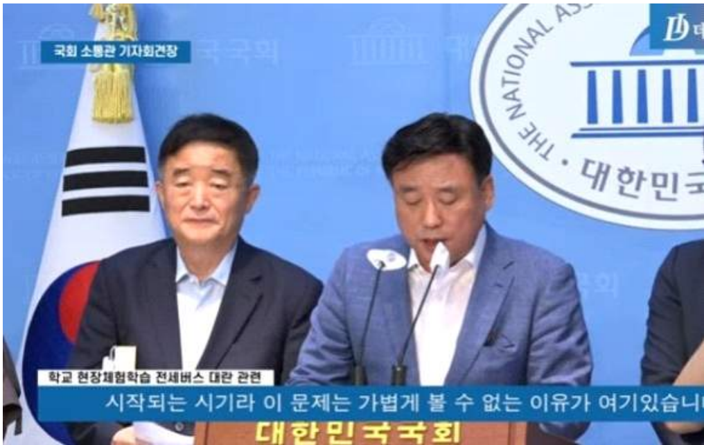
어린이통학버스 관련 국회 소통회관 기자회견