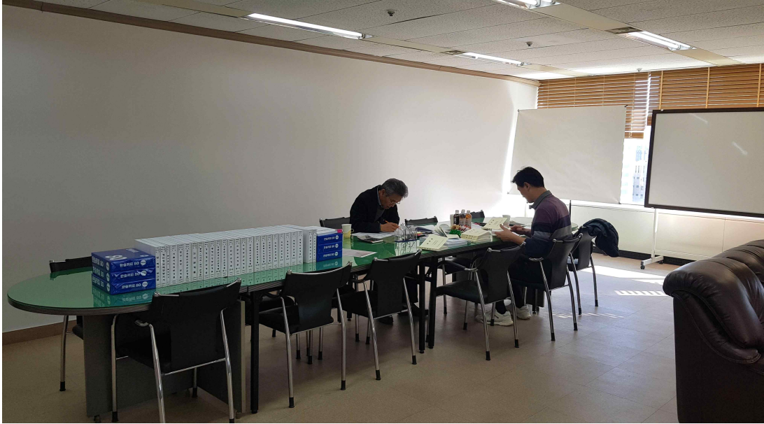
22년도 하반기 감사(1.30~31)